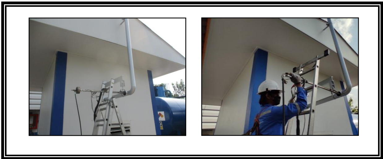
รูปที่ 3.1-1 จุดตรวจวัดคุณภาพอากาศจากปล่องปล่อยทิ้งอากาศเสีย บริเวณปล่อง Generator ในวันที่ 30 พฤษภาคม พ.ศ. 2565

จุดตรวจวัดคุณภาพอากาศจากปล่องปล่อยทิ้งอากาศเสีย บริเวณปล่อง Generator ซึ่งดำเนินการตรวจวัดในวันที่ 30 พฤษภาคม พ.ศ. 2565 ดังแสดงในรูปที่ 3.1-1