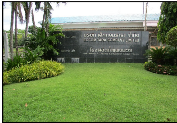
รูปที่ 1-1 ภาพถ่ายบริษัท เอ็กคอมธรา จำกัด (แพงพวย)

บริษัท เอ็กคอมธรา จำกัด (แพงพวย) จึงมอบหมายให้บริษัท เอ็นไวร์โพร จำกัด เป็นผู้ดำเนินการตรวจวัดคุณภาพสิ่งแวดล้อมและจัดทำรายงาน ทั้งนี้เพื่อนำผลที่ได้ไปสู่แนวทางปฏิบัติโดยการจัดทำมาตรการลดผลกระทบสิ่งแวดล้อม รวมทั้งด้านอาชีวอนามัย และความปลอดภัยของพนักงานด้วย